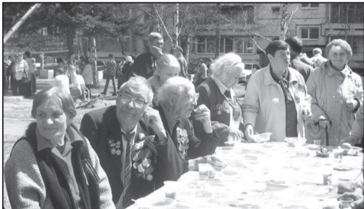
Эта фотография сделана 9 мая во время празднования Дня Победы. Сейчас в Совете ветеранов полным ходом идет подготовка к юбилею Победы, который будем отмечать в мае будущего года.