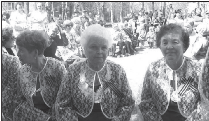
В Совете ветеранов каждый человек найдет для себя занятие по душе. Можно петь в хоре, участвовать в литературных вечерах, ездить на экскурсии.